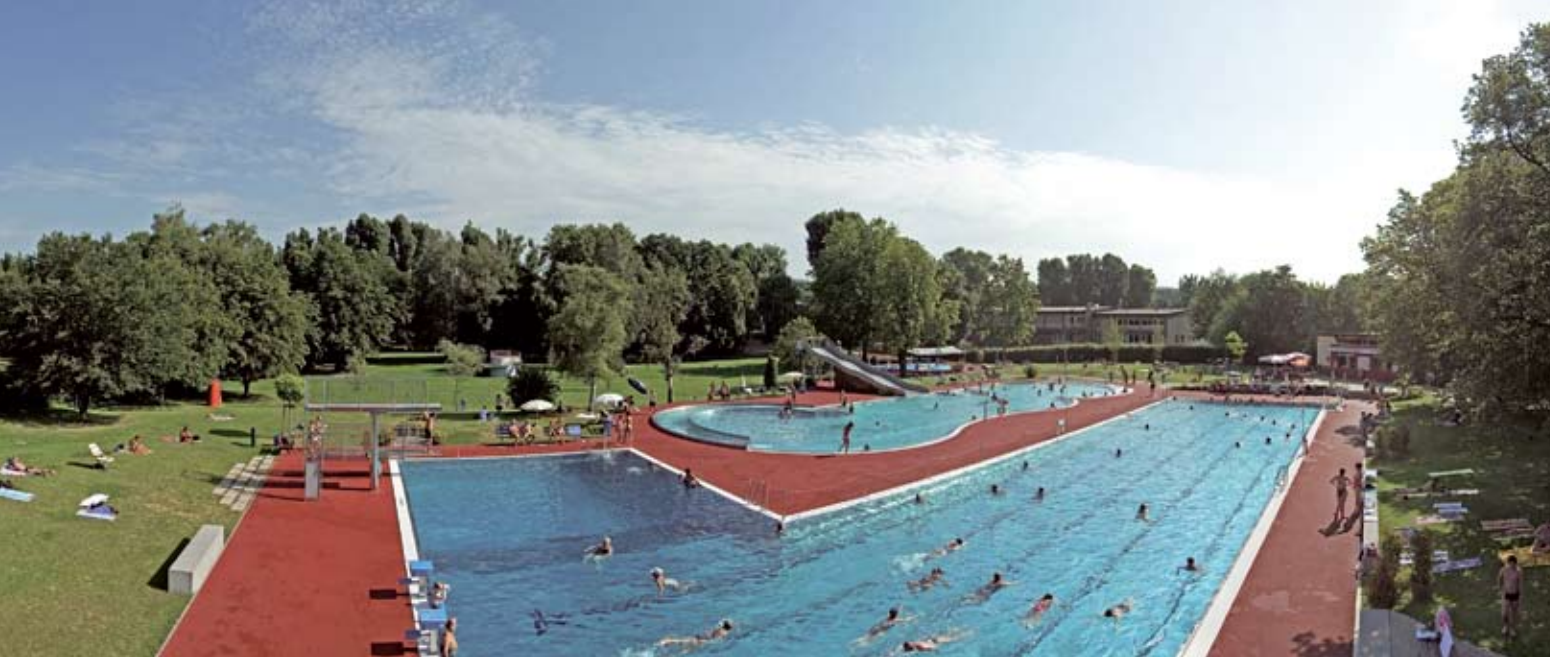
Fast schon ein Landschaftspark: Das Waiblinger Freibad liegt zentral und doch idyllisch in der Talau.

In Waiblingen stehen Freizeitschwimmern, Schulen und Vereinen vier Hallen- und zwei Freibäder zur Verfügung.