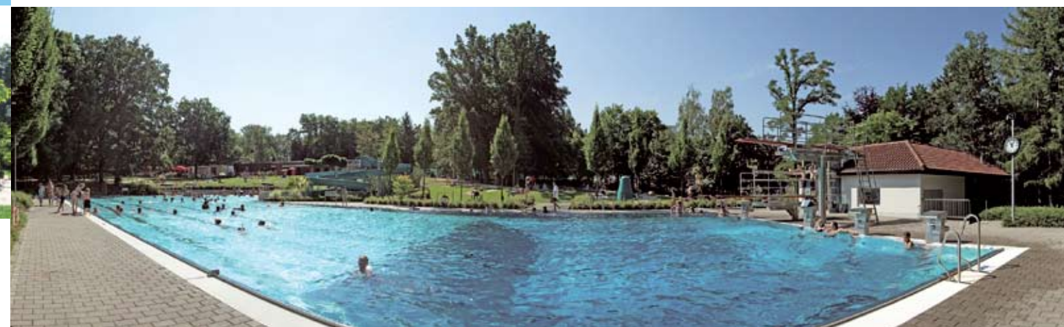
Schön ruhig am Wald gelegen bietet das Bittenfelder Freibad einen hohen Erholungswert.

Im Kinderplanschbecken baden die Kleinen bei etwa 26° C und im Sandkasten lassen sich ganz hervorragend große Burgen bauen.