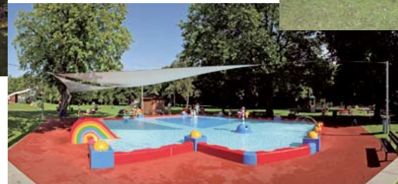
Im ca. 26° C warmen Kinderplanschbecken lässt es sich nach Herzenslust und vom großen Sonnensegel geschützt planschen.